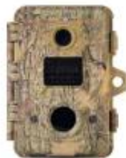
Spypoint BF-6 vildtkamera Topmodel fra markedets førende producent 1.695 kr. (SPAR 500 kr.)