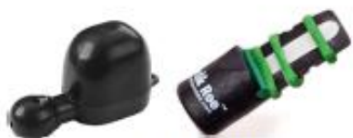
Diverse bukkkald Fra 199 kr.